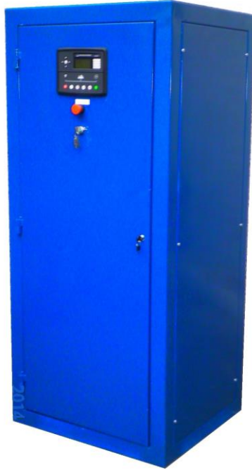
Tablero de control y transferencia Mod. Dgt900/480/tc