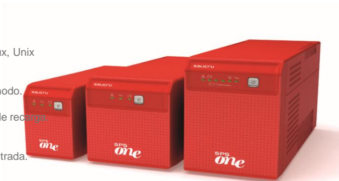
Gama SPS.ONE A